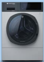
starLine prime steen AEA1.109

Snel en eenvoudig: dit is de Schulthess proLite Collection. Deze collectie is gemaakt voor kleine bedrijven - zoals wasserettes - en heeft alles wat het onmisbaar maakt voor deze branches. Met speciaal voor hen ontwikkeld gereedschap wordt het doseren van wasmiddel, het doen van de was en het afrekenen van de was kinderspel. Dit is de magie van Schulthess.